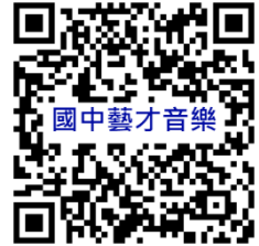
桃園市國民中學藝術才能音樂班 鑑定線上報名系統